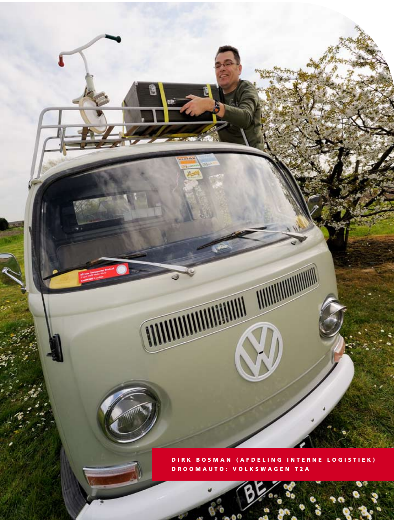
DIRK BOSMAN (AFDELING INTERNE LOGISTIEK) DROOMAUTO: VOLKSWAGEN T2A