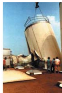
Een rekenfout haakt de bodem onder uw voeten weg.

Standaard meeverzekerd zijn de noodzakelijke verweer- en gerechtskosten. In combinatie met een Aansprakelijkheidsverzekering voor Bedrijven geeft de Beroepsaansprakelijkheidsverzekering een zo volledig mogelijke dekking voor financieel nadeel (vermogensschade), zaak- en personenschade.