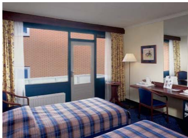
Geboekt bij u - uitzicht 'sur la mer' bijke uitzicht 'sur la mer'.

Op het gebied van de beroepsaansprakelijkheid gaan de ontwikkelingen razend-snel. De oorzaken zijn divers. Wettelijk bestaat er steeds meer gelegenheid om (vrije-)beroepsbeoefenaars aansprakelijk te stellen voor eventuele fouten. En het maatschappelijk besef groeit om deze mogelijkheden actief te benutten. Een goede verzekering is daarom noodzakelijk.