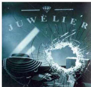
Dieven zijn niet altijd voor een gat te vangen.

Nassau verzekeringen heeft de Juweliers Blockpolis ontwikkeld, die een zeer ruime dekking biedt tegen verschillende vormen van diefstal (bijvoorbeeld inbraak of overval). Sieraden, klokken, horloges en andere kleinoden en geld vallen niet alleen onder de verblijfsdekking, maar indien gewenst tot een bepaald bedrag, ook wanneer zij zich buiten het risico adres bevinden. De verzekering is dan tevens geldig tijdens het transport. Ook de verzending van pakketjes kan worden meeverzekerd.