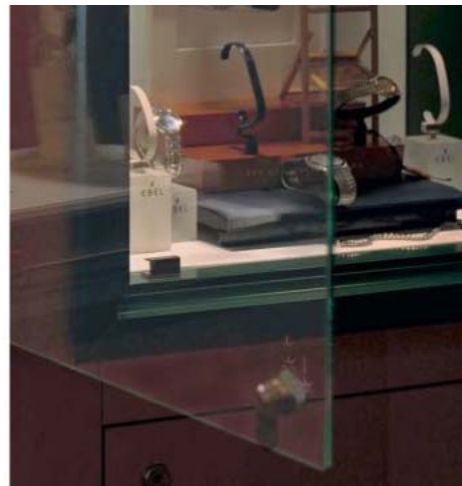
Diefstalgevoeligheid kent geen tijd.

Juweliers hebben beroepsmatig te maken met voorwerpen van hoge waarde. Kostbaarheden die maar al te vaak op onrechtmatige wijze van eigenaar verwisselen. Geen wonder dat een juwelier veel aandacht besteedt aan zijn verzekeringen en veel verwacht van zijn assurantie-intermediar en verzekeringsmaatschappij.