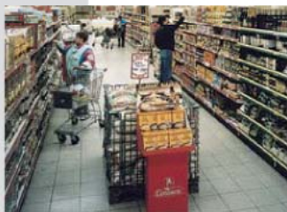
Elk bedrijf kan het mikpunt worden van sabotage.

van Corporate Risk International. CRI is een professionele en wereldwijd opererende organisatie die onder meer gespecialiseerd is in het adequaat handelen tijdens crisis-situaties. De inzet van hoog opgeleide experts kan van vitaal belang zijn voor uw onderneming. Om de crisis het hoofd te bieden, geven zij niet alleen bijstand bij het in contact treden met de daders, maar ook assistentie bij het informeren van de pers en het organiseren van recall-operaties.